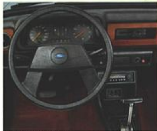
Radio är extrautrustning

tjock textilmatta, varvräknare, trippmätare, träklädd instrumentpanel, textilmatta i bagageutrymmet, vinyklätt tak, fälgringar och stötfångarhorn i gummi. Den kompletta utrustningen finner Du på sista uppslaget.