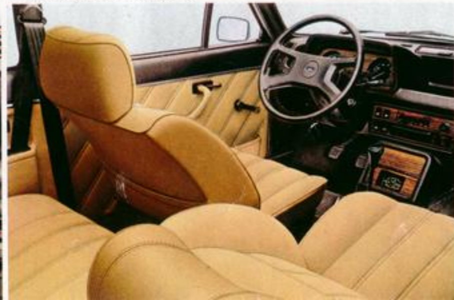
▼ Ford Fiesta 1300 S