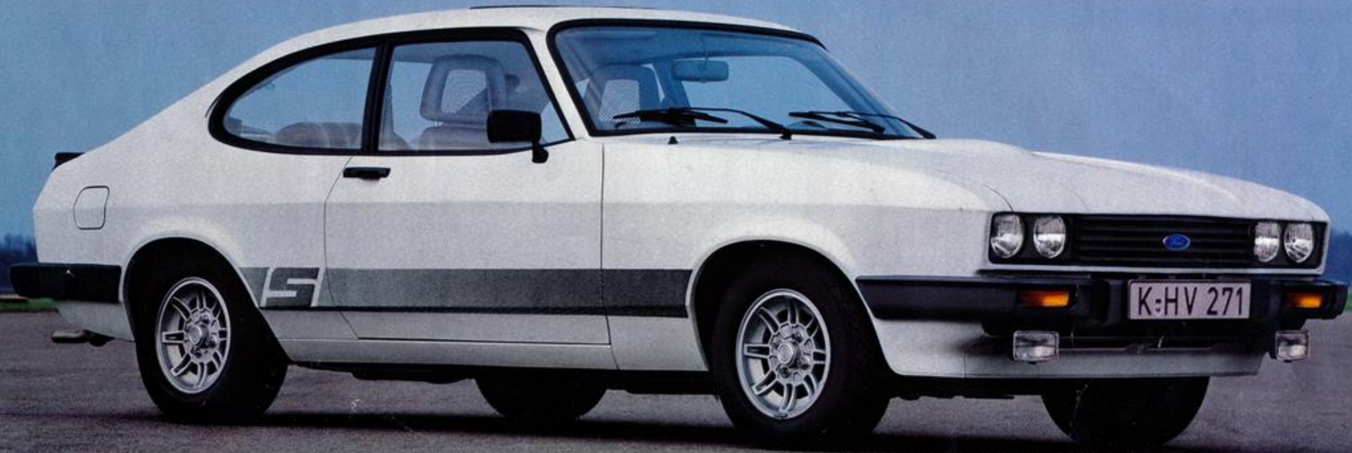
▼ Ford Capri GL

Wer die Fahreigenschaften des Capri auch in gesteigerte Leistung umsetzen möchte, bekommt den gepflegten Schub eines Sechszylinders, wenn es gewünscht wird, bei diesem Sportcoupé schon ab 2 Liter. Und selbst der Capri 3.0 S mit 101 kW hat noch einen sehr vernünftigen Preis. Eine Klasse für sich. Daß der Capri wie ein Zweisitzer aussieht, ist sicher kein Nachteil. Daß er dabei ein vollwertiger Viersitzer ist und mit seinen umklappbaren Rücksitzlehnen einen variablen Gepäckraum hat, ist ein klarer Vorteil.