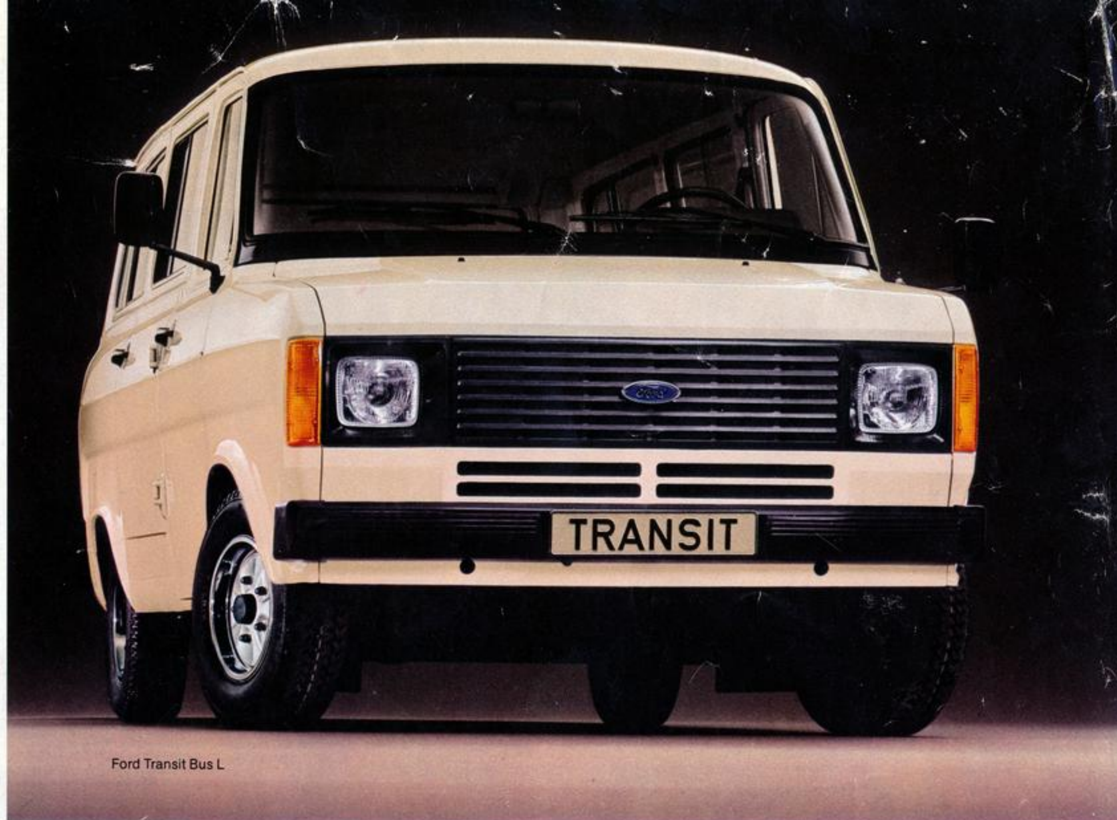
Ford Transit Bus L

Die abgebildeten Fahrzeuge sind zum Teil mit Zusatzausrüstungen ausgestattet, die gegen Mehrpreis erhältlich sind. Ihr Ford-Händler wird Sie gern über den serienmäßigen Lieferumfang der einzelnen Modelle und unser Farbprogramm informieren. Angaben über technische Daten (nach DIN 70020 und 70030) und über den Lieferumfang entsprechen dem Stand der Drucklegung und sind unverbindlich. Ford-Werke Aktiengesellschaft, Köln, Werbeabteilung. 21. Juni 1979/90 150.