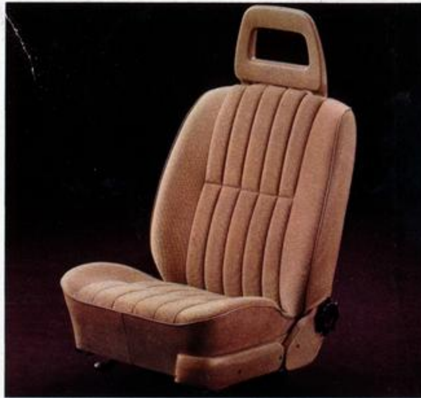
Vollschaum-Ruhesitz mit stufenlos verstellbarer Rückenlehne.

Der neue Ford Taunus: spürbar besser im Fahrkomfort.