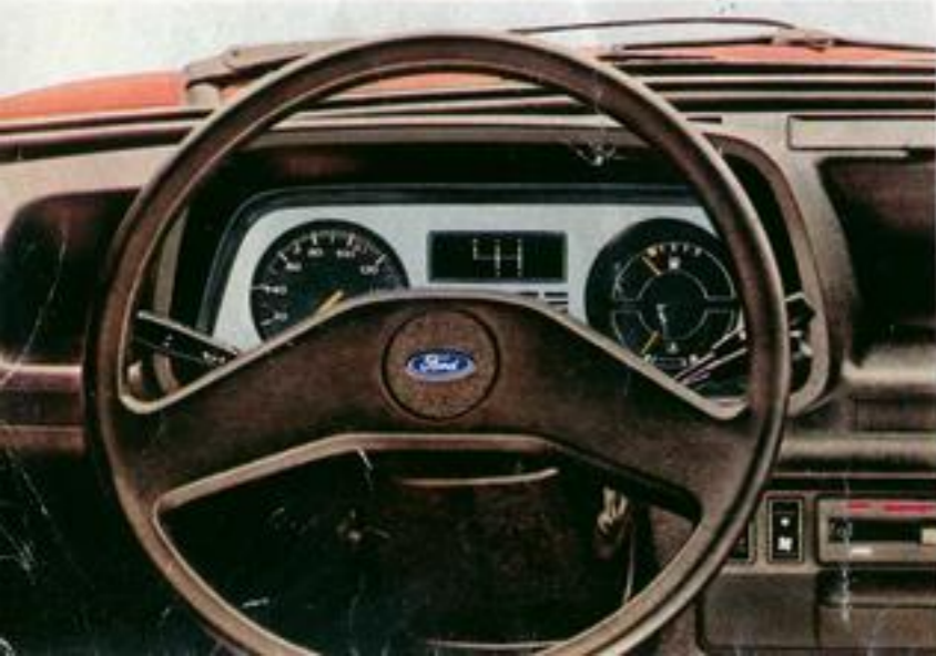
▼ Innenraum Ford Fiesta Ghia