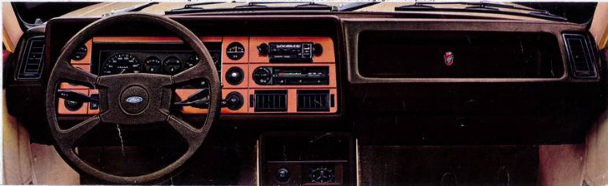
▼ Ford Granada Ghia Instrumentenfront (Klimaanlage, Radio und automatisches Getriebe auf Wunsch, gegen Mehrpreis)