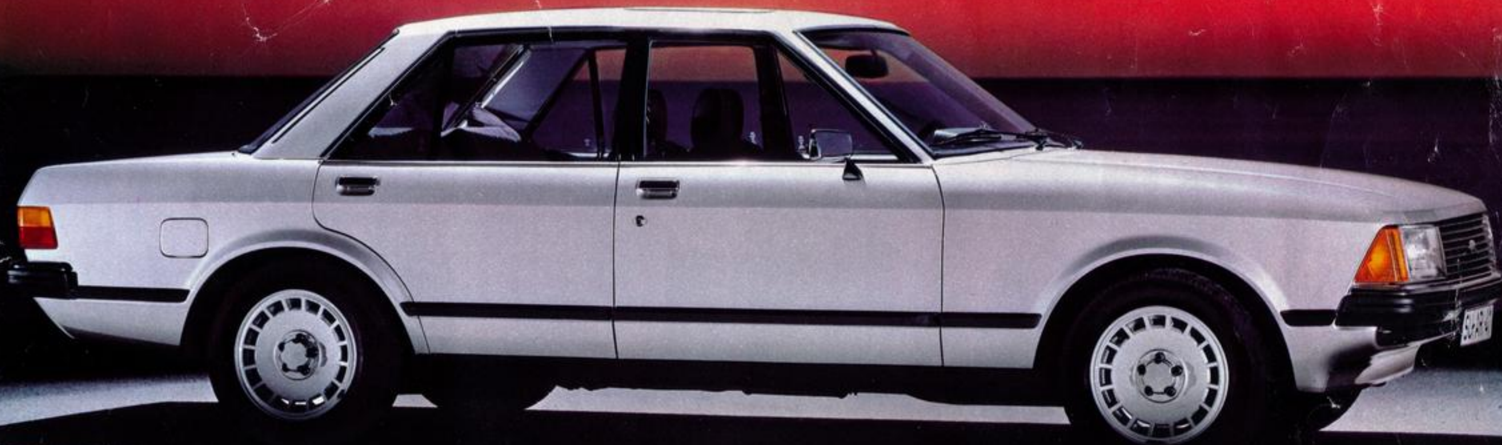
▼ Ford Granada Ghia

Und Sie haben die Wahl zwischen acht Leistungsstufen. Vier Sechszylinder: 2.0 Liter; 2.3 Liter; 2.8-Liter-Vergaserversion bis zum 2.8-Liter-Einspritzer mit 118 kW (160 PS). Außerdem vier Vierzylinder: Ein 1.7-Liter (Normalbenzin), ein 1.7-Liter und ein 2.0-Liter (Superbenzin) sowie ein 2.1-Liter-Diesel.