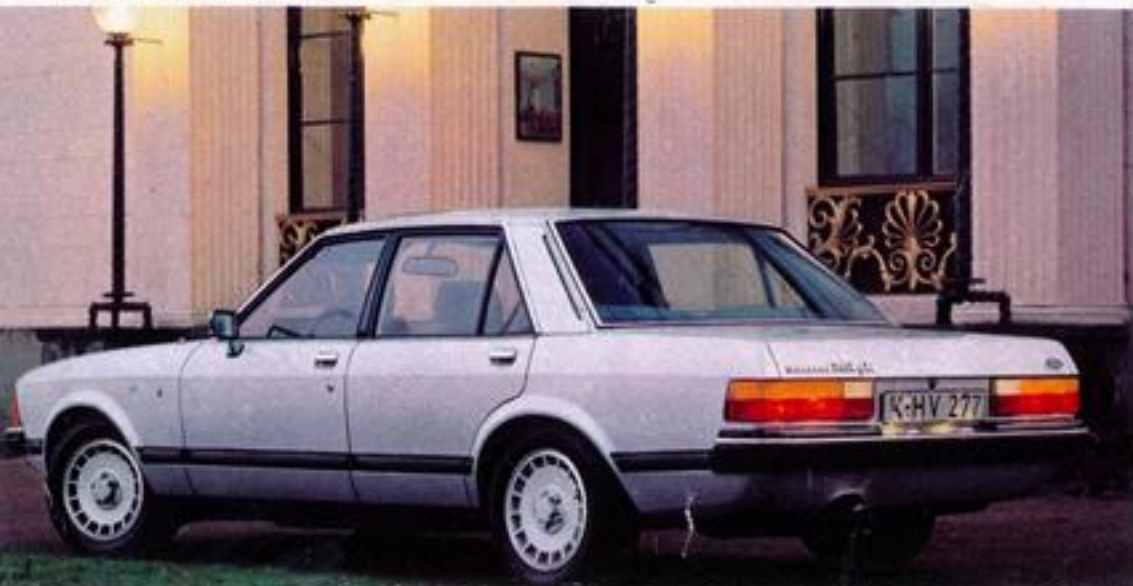
▲ Ford Granada LS (Stahlkurbeldach und Außenspiegel Beifahrerseite auf Wunsch, gegen Mehrpreis)